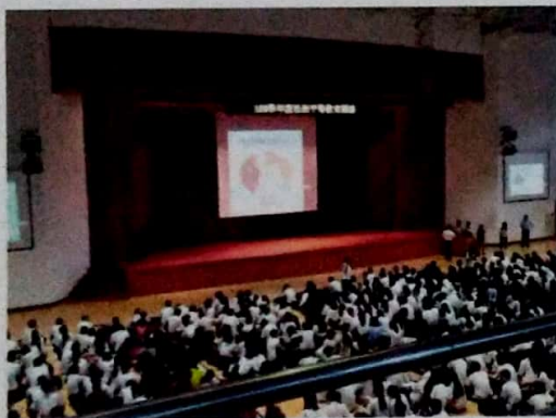
隨班參與 108 學年度性別平等教育講座