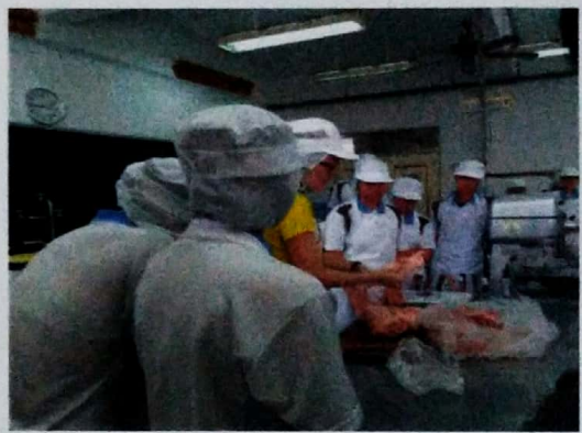
畜產加工課觀課-備料