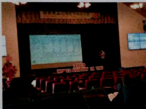
參加 2019 世界蛋品日研習