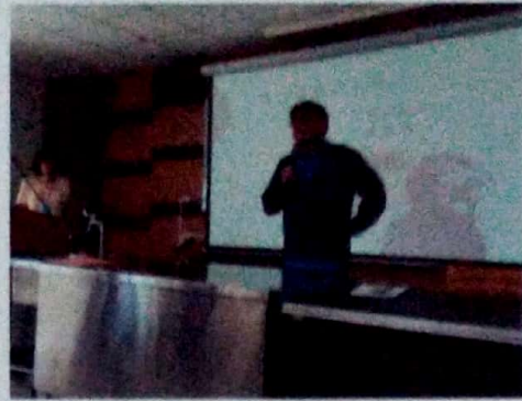
協助舉辦新課綱課程教師專業進修研習 - 生物技術之菇類栽培組織培養