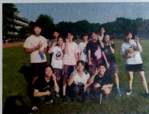
替參與運動會預賽的學生加油