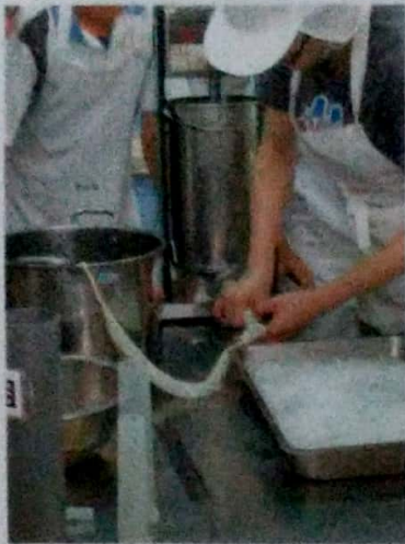
畜產加工課觀課-香腸製作