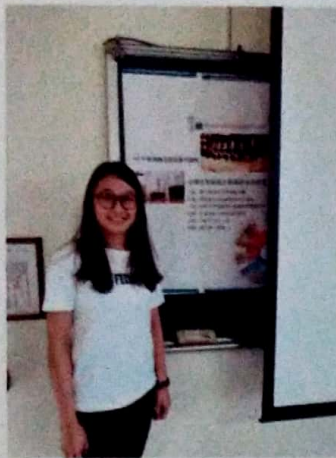
協助舉辦 108 年度專題及創意製作課程 - 消費者型描述分析品評方法研習