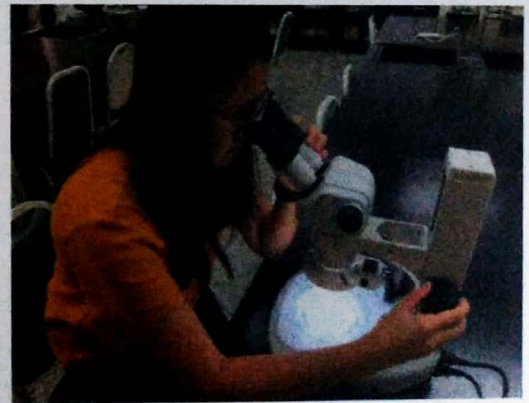
與選手一起飼料辨識