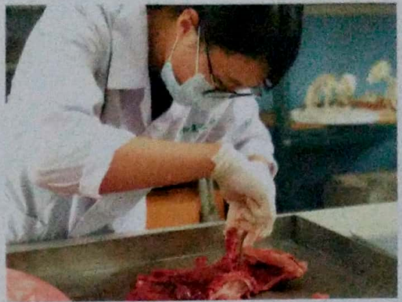
動物保健課程觀課-豬隻解剖病理觀察