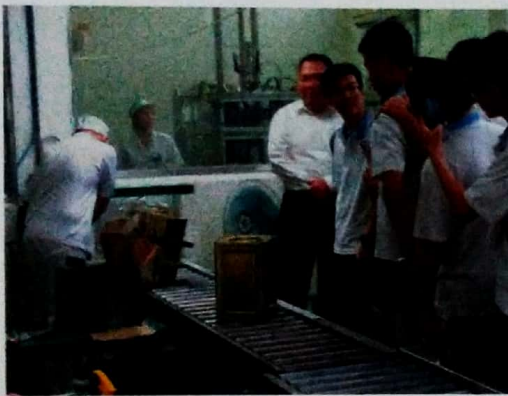
到台農鮮乳廠參訪

進入了十月份，我開始實際的上課，老師給我機會，讓我從簡單的課程開始上台練習，讓我去自訂課程主題，思考如何呈現給學生，在選擇主題的當下其實很猶豫也很擔心，不知道自己能不能掌握並完整呈現給學生，所以最後選擇了我感興趣的主題來教，在備課的過程中剛好以前學校舉行世界蛋品日研習，與我的授課內容有相關，所以去參加了兩天的研習，將研習的內容運用在課程中。教案完成後與老師討論內容，老師給我許多的建議，讓我的課程設計更流暢、方向更明確。試教後回想自己授課的表現，覺得自己還很多需要加強改進，老師也給我很多回饋和鼓勵，例如學生狀況的掌握、ppt 字體大小、影片的使用、音量的控制以及問答的技巧等都是我能去改進的。經過這次的試教，我才了解教高中職與之前在帶補救教學是完全不一樣的，學生人數增加、學生上課的態度等都有很大的差異，當然授課內容更是，知道了自己的不足去改進，希望下次的試教我能做的更好。