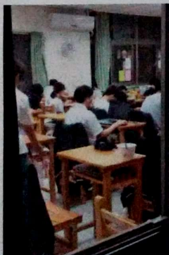
觀察學生晚自習狀況