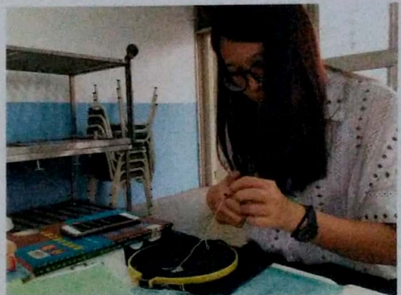
與選手一同練習縫合